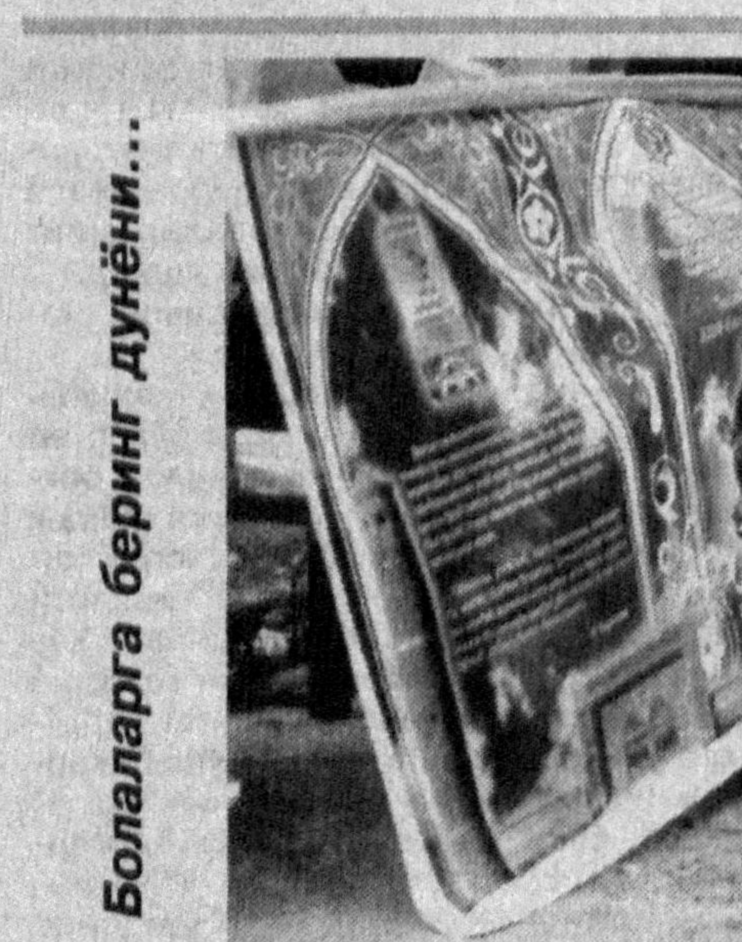
Болаларга берилг дунёни...