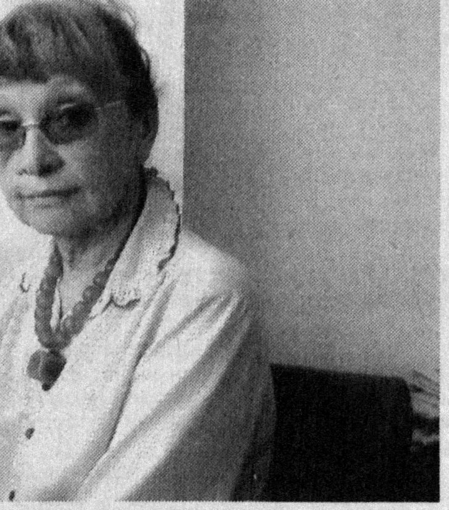
Бошланиши биринчи бетда.

Ватанимиз мустақиллигининг ўн саккиз йиллигини муносиб кутиб олиш, тарихан қисқа бу даврнинг ёш давлатимиз учун сиёсий соҳада, давлат ва жамяят қурилиши, иқтисодий ва маънавий, ижтимоий ҳаёт, суд-ҳуқуқ тизими, ташқи сиёсат ва хавфсизликни таъминлаш борисада ҳар томонлама ривожланиш ва юксалиш, жаҳон ҳамжамятидан муносиб ўрин эгаллаш даври бўлганини чуқур очиб беришга ҳизмат қиладиган комплекс маданий-маърифий тадбирларни амалга ошириш;