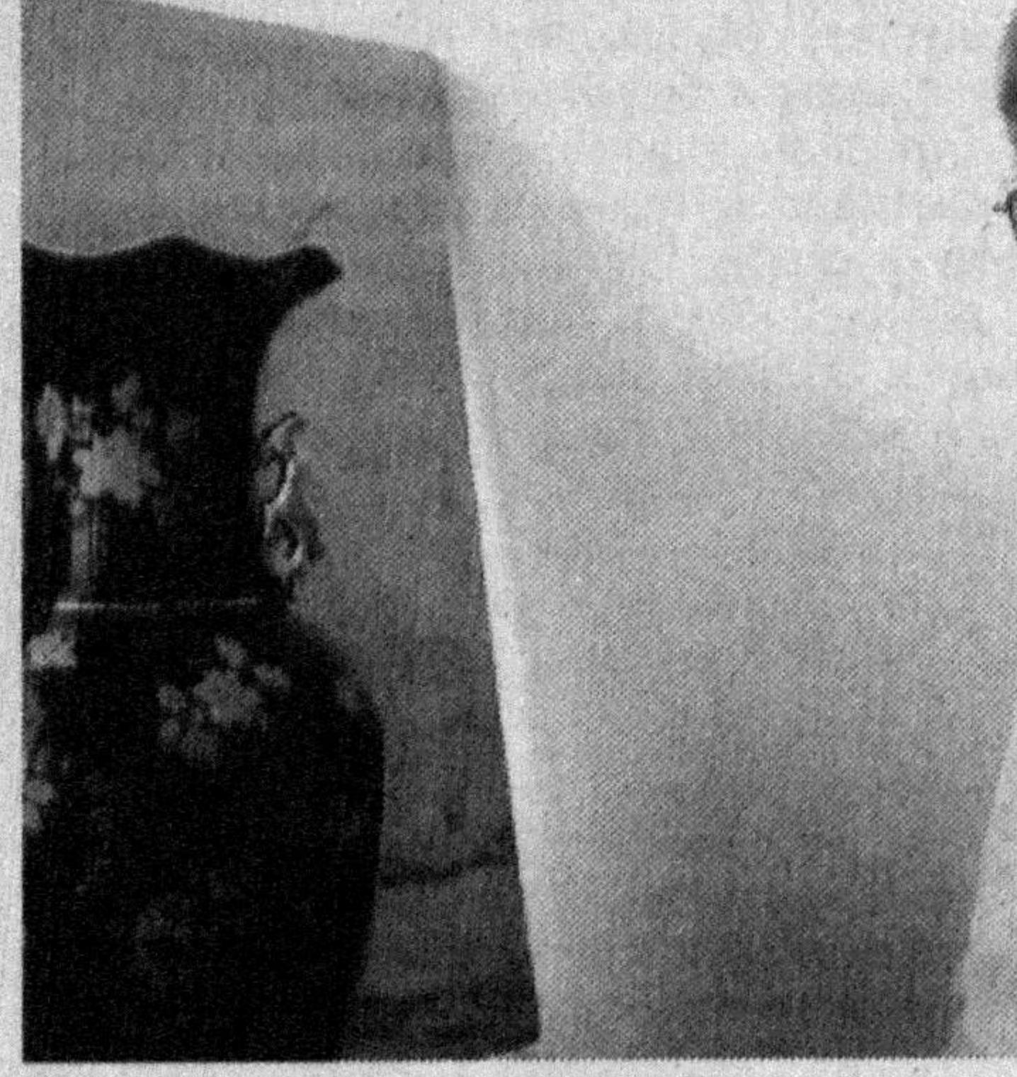
Бошланиши биринчи бетда.

аҳолисини ижтимоий жиҳатдан қўллаб-қувватлашга қаратилган ўнлаб халқаро лойиҳалар, бу йўналишда амалга оширилётган ишларнинг дастлабки саралари тўғрисида ҳам изчил ҳикоя қилинади.