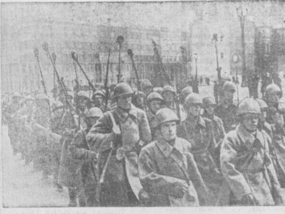
Уша кунлари Москва кўчалари шундай эди.