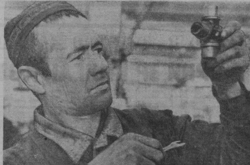
Беш йиллик илғорлари

Улардан ташқари, республика «Билим» жамияти Улуғ Октябрь социалистик революциясининг 50 йиллик тўйига бағишлаб 50 дан ортиқ номда турли хил брошюралар нашр этади. Брошюраларнинг бир қисми нашр этиб булинди ва нашр этилмоқда. Тарих фанлари кандидати А. Ф. Яцишанининг «Ўзбекистоннинг ишчилар синди, тарих фанлари доктори Х. Т. Турмушовнинг «Мехнат ва галаба йўли»да ҳамда пролетариат доҳисы Владимир