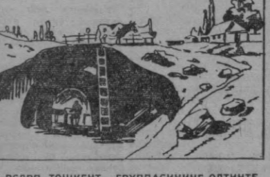
РСДРП тошкент гуруҳининг олтинчи падаги яширин босмаҳонаси.

Туркистон социал-демократлари партиянинг IV съездида қатнашиб, унда В. И. Ленин таълифларини қаттиқ туриб ҳикоят қилдилар.