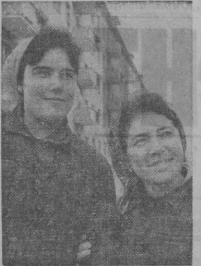
Чилонзорнинг 13-кварталда москвалик қирдошлар кўлаб турар-жой биноларини барпо этишгаётир.

Намлиқни ўлчайдиган ВТФ аппарати пахтадаги, унинг толасидаги ва чигит таркибидagi намликни 5 минутлик вақтда аниқлаб беради. СХЛ-3 лаборатория сўшиласи кинса вақтда пахтанинг намлигини 15 процентга камайтиради. Бу эса хом ашёнинг қанчалик хас-хашакка арақлашганлигини аниқлаш имконини беради. Бу приборлар пойтахтдаги «Гидромет-прибор» заводида кўп-кўп ишлаб чиқарила бошланди.