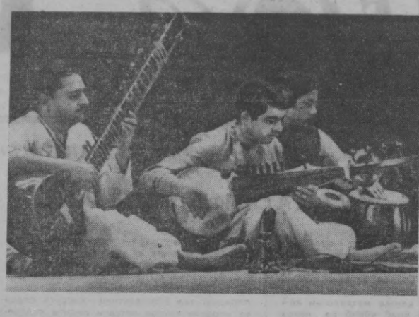
СУРАТЛАРДА: созандалар классик күй икром этмоқда.