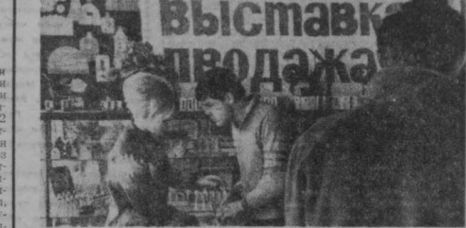
Чилонзордаги савдо марказида Тошкент парфюмерия фабрикаси ишлаб чиқараётган махсулотларини сотиш выставкаси ташкил этилди...