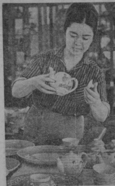
Тошкент чинни заводи коллективи ишлаб чиқаратган хилма-хил маҳсулотлар фақат республикаимиздагина эмас, балки иттифоқимизда ҳам манзур бўлмоқда. Чинни асбоблар ишлаб чиқаришда хотин-қизлар ҳам ўз маҳоратларини намойиш қилаётирлар. Завод коллективи Совет ҳокимиятининг 50 йиллик юбилейига атаб 280 минг сўмлик совға яратилди.

Ю. ТОЛИПОВ. Тўқимачилик комбинатининг ишчиси.