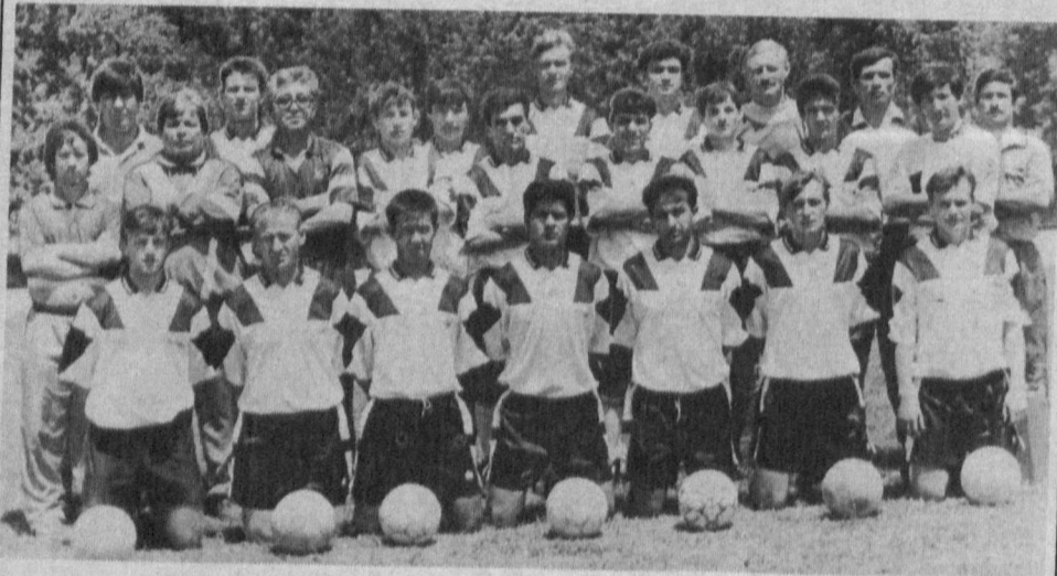
НА СНИМКЕ: победитель первенства Узбекистана 1995 года среди коллективов первой лиги — ургенчский футбольный клуб «Динамо».

Материалы подготовлены соб. корр. по Хорезмской области.