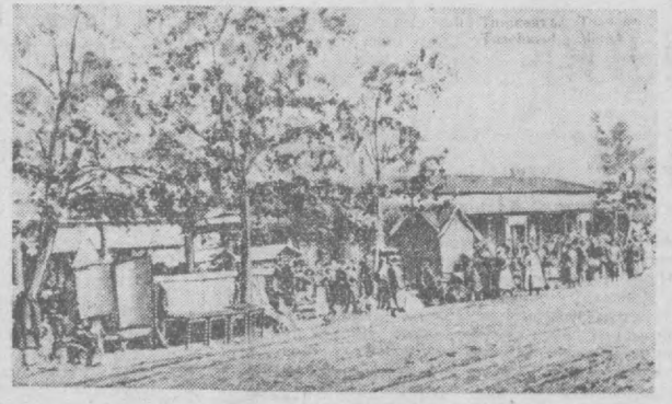
Мана шу сиз кўриб турган Тошкент марказида бир вақтлар Пиён бозори жойлашган эди. У ерда кишин-бизн ифлос, лойгарчилик бўларди. Кишилар арава, от, эшак миниб келишарди. Махсулотлар ва саноат моллари дўкончаларда ёки шундай йўлда сотилаверарди. Эндликда фақат коидукторларгина янглишиб, бу жойнинг эски номини атаб юборишади.

Унинг номини бугун шаҳар ахли бидиди. Масумов десагиз ҳао бир киши «ха профессор Содин Алиевични?» дейди. Лекин Содин Алиевичнинг ўзи бугун вича ахамият бермайдди. У кишилар пардига малҳам бўдубчи хиробгична бўдуб қолмай, шаҳар Советининг депутатлиги сифатида доимий сивхат-саломатлик комиссиясига бошчилиги кидиди.