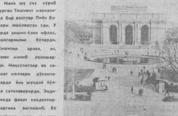
Уша бозорнинг ўрнида хозирги кунда йирик савиат даргоҳи—Алишер Навоий номи академик катта опера ва балет театри жойлаш-гоҳ, фонтан сув сочиб ган. Атроф сўлиқ ором турбиди.