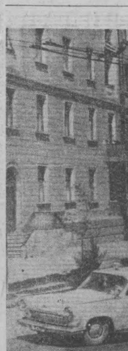
Бугунги Тошкент. Суратда: Ново-Московский кўчаси.

Дахшатли уруш йилларида эса Тошкент душман устидан галабани тобловчи ёшлардан бири бўлди. Шаҳримизга мамлакатимизнинг қарғий районларидан ўнлаб завод ва фабрика, ўн минглаб кишилар кўчиб келди.