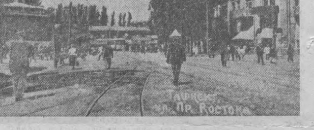
Мана, «Правда востока» кўчаси. Ана шу икки қаватли уйда бир қанча редакциялар жойлашган эди. Бутун эса бу бино кўп қаватли, икки томонга қанот ёган. Бу Узбекистон КП Марказий Комитетининг Бирлашган ширети-бирки газета-журнал комбинатидир. Бу ердан хартон ва оқшода машиналар юз минг нусхалаб газета ва журналлари эгаларига етказилади.

Фармоннинг тағдида Бутунроссия Марказий Икרוия Комитетининг раиси М. Калинин. Кремль, 1924 йил, 19 апрели, деган сўзларни ўқш мумкин.