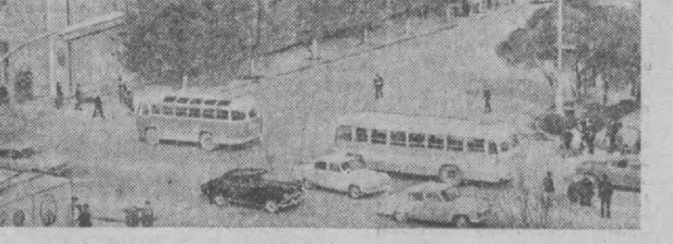
Эллик йил муқаддам «НАША ГАЗЕТА» САҲИФАЛАРИДАН

1917 йил 10 майда Тошкент уезди халқ депутатлари Советининг мажлиси уезддаги ишнинг аҳволи тўғрисидаги масалани ҳар томонлама муҳоама қилиб, қуйидаги қарорни қабул қилди: 1. Солдат, ишчи ва деҳқон депутатлари Советида ўз ифодасини тошган демократия ташкилотига уезддаги ташкилий аҳволини яхшилаш ва озиқ-овқат қийинчилигига барҳам бериш мумкин.