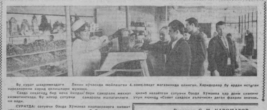
Бу сурат шаҳримиздаги Ленин кўчасида жойлашган 4-олинмак магазинида олинган. Харидорлар бу ердан истаган нарсаларини харид қилишлари мумкин.