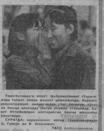
Улан-Батордаги мовут фабрикасининг тўқувчи- лари тайёрлаш билан меҳнат қилишмоқда. Корхона- ни реконструкция қилингандан сўнг янгирув, тўқу- ва бошқа цехларда қисан уюмни станоклар, Со- вет Иттифоқдан келтирилган бошқа жиҳозлар ўрнатилди.

Республика Қурилиш материаллари министр- лигига қарашли «Ўзбек- мармер» бирлашмаси вакиллари Тошкент метро- росини бунёд қилватган мутахассислар билан учрашдилар. Фойдала- учрушув Тошкент метро- роси станциялари учун етказиб берилган ма- рмар ва гранит тош- ларнинг мудатли, улар- нинг ҳажминин белги- лашига бағишланди. Қу- рилиш материаллари корхоналари Тош- кент метроси учун ав- густ ойида 290 квадрат метр оқ ва 100 квадрат метр оқ-қора мармар етказиб берадиган 200 квадрат метр ҳажмида қора ранги тош Укра- инадан таъбир қилин- гади. Мармарларнинг асосан республикамиз- нинг Нуротдаги кон- ларида тайёрланади.