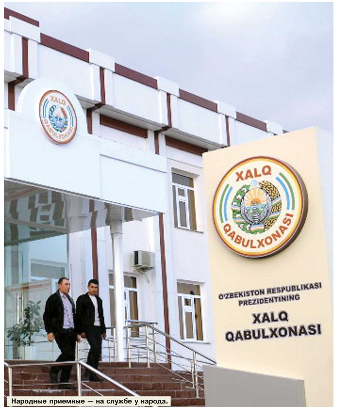
Народные приемные — на службе у народа.

Эти очевидные причины в большинстве случаев принуждают скрывать «кризисы» или не вспоминать о них. Понятно, что путем прикрытия заброшенных и разрушенных территорий красочными изображениями водопадов и зеленого ландшафта нельзя устранить проблему. Точно так же нельзя озарить сердца высокопарными, бессмысленными словами. Да, это может лишь немного приукрасить истинную ситуацию, подарить минутное настроение и спокойствие. Однако замалчивание проблемы не является благом. И мы уже видели, что это не принесло нам решения.