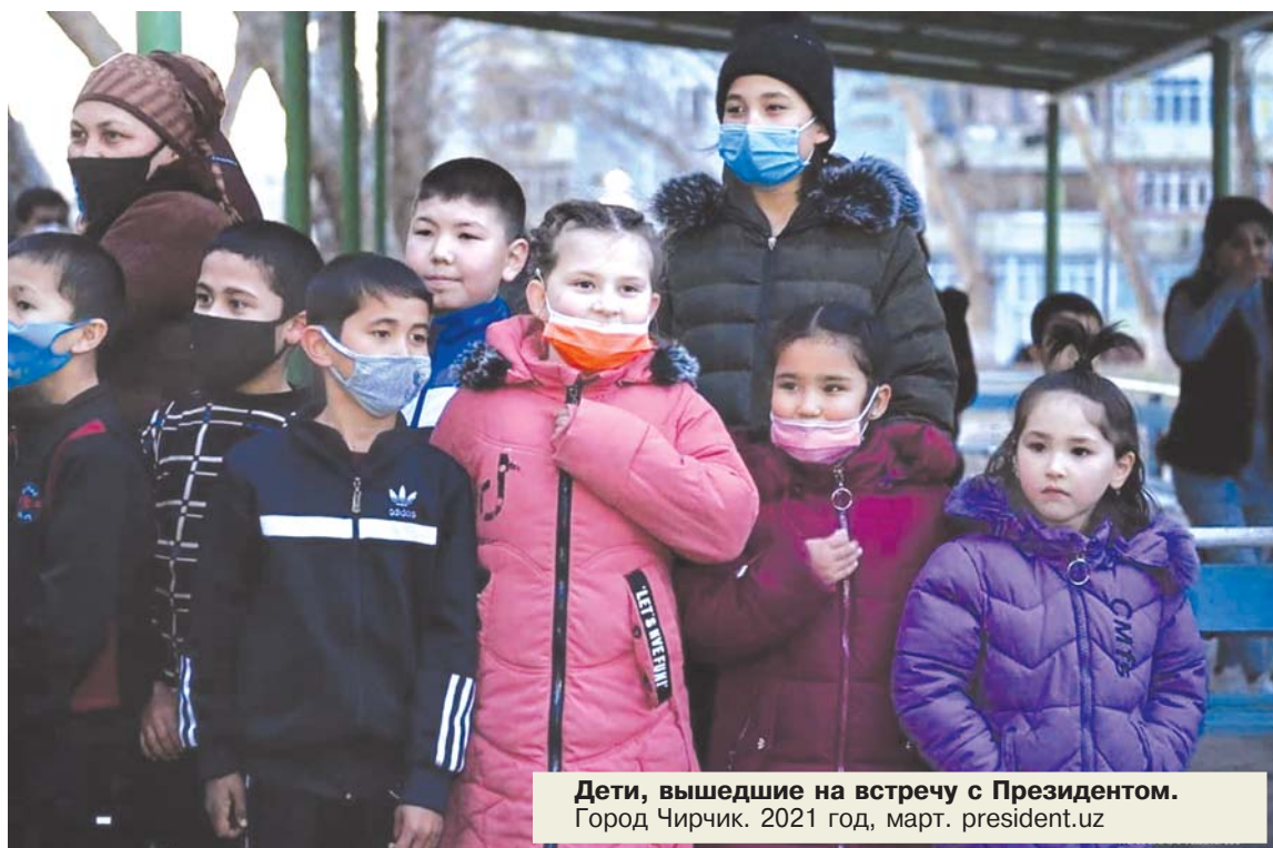
Дети, вышедшие на встречу с Президентом. Город Чирчик. 2021 год

Конечно, в свободном обществе мы стараемся выглядеть еще более свободными. Некоторые из нас давно болеют «политическим популизмом», даже научились завоевывать ложный авторитет с помощью критики, отрицания, непризнания выполняемой работы. Но истина состоит в том, что сегодня — это уже не вчерашний день. К нашему счастью, сегодня в нашем Узбекистане кардинально изменилась нравственная атмосфера в государстве и политике.