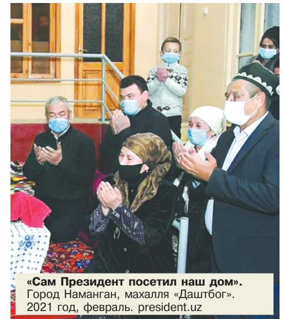
«Сам Президент посетил наш дом». Город Наманган, махалла «Даштбюк». 2021 год, февраль.

Президент Шавкат Мирзиёев «слонал» эти устои. Будучи главой государства, он как обычный мусульманин участвовал в похоронных процессах, не стеснясь проявлять свои человеческие и духовные качества. В дни Хайита и других мусульманских праздников посещал больницы, дома для престарелых, навещал одиноких, оставшихся без опеки людей. Фотографии Президента в тюбетейке на церемонии в Ашхабаде, посвященной памяти отца главы Туркменистана, называют на то, что им избран новый путь для государства и народа. Хотя чуть