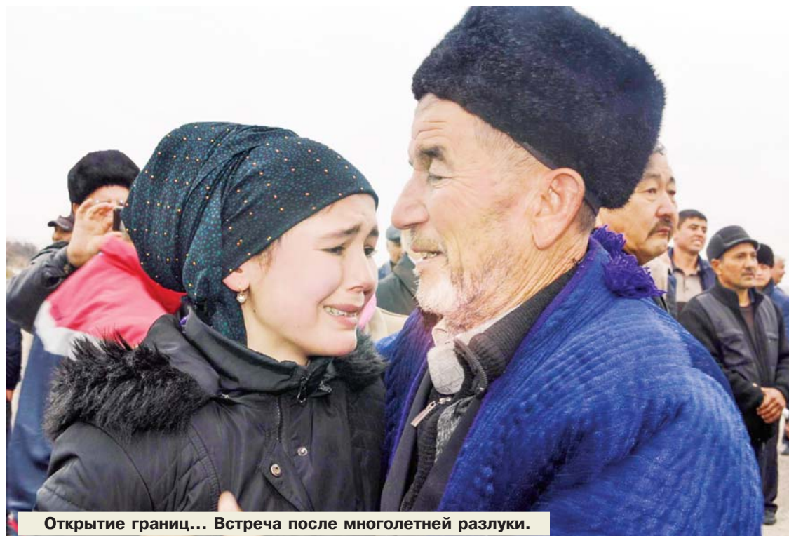
Открытие границ... Встреча после многолетней разлуки.