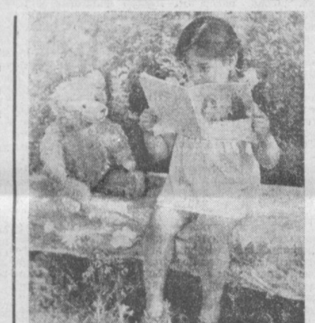
«БИРИНЧИ МУТООЛА».

Тошкент халқ ҳужалиги институтинда янги ўқув йилини кутиб олиш ҳар йили анъанавий тусда — студентлик тантанали равишда қабул қилиш маросими билан бошланади.