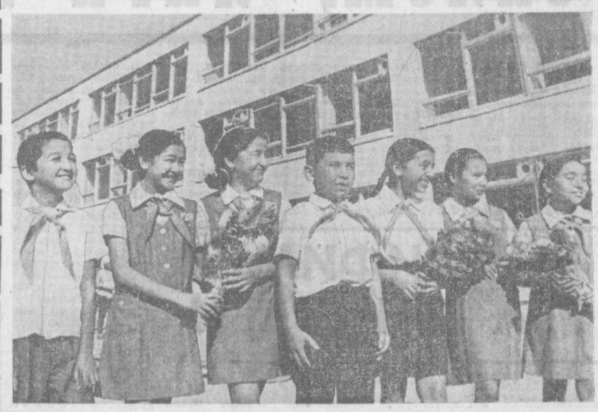
Қувончи биринчи сентябрь ҳам етиб келди. Эртага янги ўқув йилининг қўнғироқлари янграйди. Бутун минглаб ўқувчилар жонажон мактабларини кўргани келсинди. СУРАТДА: 241-урта мактабнинг бир гуруҳи ўқувчилари ўз мактабларини кўздан кечиришмоқда.