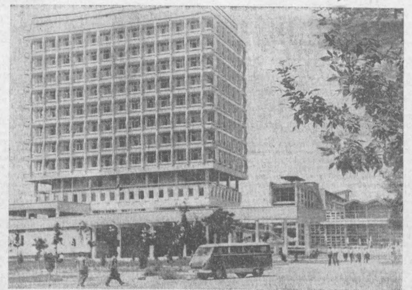
Кўз олдинида салобат тукиб турган бу бино — Студентлар шаҳарчасида қад кўтарган В. И. Ленин номи Тошкент Давлат университетининг маъмурий биносидир.

КПСС Марказий Комитетининг КПСС XXIV съезидега ҳисобот доқладидеда бунча резолюцияда таъкидлаб ўтилганидек, «Съезд ошқаришга ўз функцияларини янада тўлиқроқ амалга оширишлари, экономика ва маданиятнинг ривожланишига, — халқ фаровонлигини оширишга қўйилган таъсир кўрсатишлари, аҳолига социал маъиший хизмат кўрсатиш, жамоат тартибининг саранжом-масалалари билан кунт билан шугуллаишлари керак», деб ҳисоблайди.