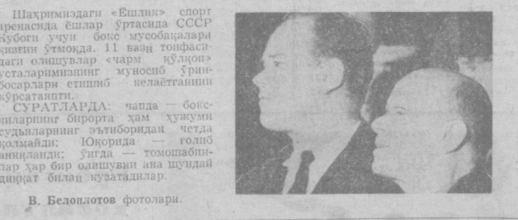
В. Белополютов фотолари.