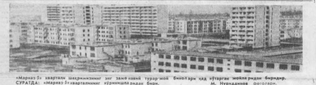
«Марказ-5» квартал шаҳримизнинг энг замонавий турар-жой бинолари қад кўтарган жойларидан биридир.

Партия XXIV съезди хўжалик партиявий раҳбарлик қилишининг янги уқларини очиб берди. Съезде партия ташкилотлари олдига коллективлар ҳақидаги хат бир масалани хат қилишга илҳия асосда эндошиш вазифаси юкленди.