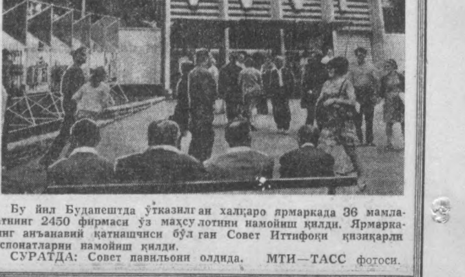
Бу йил Будапештда ўтказилган халқаро пррмаркада 36 мамлакатнинг 2450 фирмаси ўз махсулотини намойиш қилди.

ВАШИНГТОН. ТАСС муҳбири В. Чернишев Исроил оқулувачилари босиб олинган ерларини тез суръатлар билан ўзлаштириб, мустамлакага айлантиришмоқдалар.