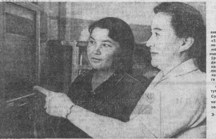
Ўзбекистон Фанлар академияси электротехника институтининг «Тартибни тузишларни текшириш» бўлимида мольбден кристалларнинг тартибни тузилишини ўрганиш давом этмоқда. Бўлим юқори малакали ходимлар бошчилигида бу иш устидан катта муваффақиятларга эришмоқда.

Яна шунини таъкидламоқчимизки, Ички иш-лар органлари шахсий осбавининг тарбияси, маданий савиясини юксалтириш масаласига ҳам янги катта эътибор бериб келинди ва шун-дай бўлиб қолди. Биз қонунибузарларга қар-ши фақат қонуни йўли билан курашни прин-ципига ҳаммаи амак қилмадик. Миллиция шун-дай ишласинки, аҳоли унинг пок ниятини ту-шунсин ва ҳаммаи уни қўлласин. Бизнинг кун-имиз, ишимизнинг муваффақияти шунга боғ-лиқдир.