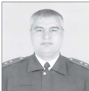
Подполковник Илҳомжон Камолитдинович ОРТИКОВ –

Республика ИИБ Патруль-пост хизмати ва жамоат тартибини сақлаш бош бошқармасига бевосита бўйсунувчи Хорижий давлатлар дипломатик ваколатхоналарини қўриқлашни таъминлаш бўйича алоҳида милиция батальони командири лавозимига