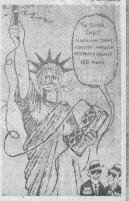
«ОЗОДЛИК» СЕРГАК.

АҚШ Марказий разведка бошқармасининг директори Р. Холмс матбуот вакиллари билан суҳбатда айтдики, унинг қарамоғидеги ташкилотнинг асосий вазифаларидан бири «МРБ ишини Америка жамоатчилигига мослаштиришдан, аслича иш тутмасликдан иборат». Аслида эса Америка разведкасининг бошлиги ходимларининг ватандошлари тўғрисида тўла ахборот йиғишга қаратилган ҳар қандай уринишини қўллаб-қувватлайди.