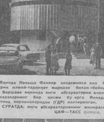
Яқинда Польша Фанлар академияси яна бир йиллик илмий-тадиқиот маркази билан «Бойди» — Варшава яқинида янги обсерватория очилди. Ниҳозларнинг бир қисми бу ерга Пенанадаги оптика корхоналаридан (ГДР) келтирилган. СУРАТДА: янги обсерваториянинг миносаси.