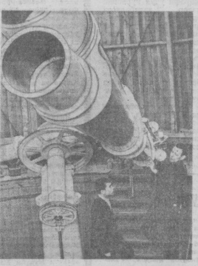
Ўзбекистон Фанлар академиясига қарашли астрономия институтини кўни неча 100 йилга тўлди. Бу институт, айниқса, Совет ҳокимияти йиллари даврида катта илмий даргоҳга айланди. Институт илм ахли мамлакатимизда ҳамда кўпгина чет эл астрономия-обсерваторияи марказлари билан яқин алоқалар уриган.

СУРАТДА: институт илмий ходимлари катта телескоп ёрдамида само сирларини кузатишга тайёргарлик қўришибди.