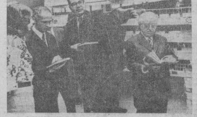
Германия Демократик Республикаси. СУРАТДА: Берлинда очилган «Совет Иттифоқи адабиети» виставасида. Бу виставка «Халқаро китоб» ва ГДР маданият министрлиги томонидан ташкил этилган.

ДЕХЛИ. ТАСС мухбири А. Аршнов хабар беради: Ҳиндистон пойтахтида Совет Иттифоқи Ўрта-Осиё Республикаларини и р г ҳозирги савгати бағишланган виставка нутқида Ҳиндистоннинг Ўрта Осиё халқлар билан маданий муносабатлари узоқ тарихга эга эканлигини, фақат СССР Ўрта кўргазмага қўйилган. Ҳиндистоннинг маориф, социал таъминот ва маданият давлат министри Нурул Ҳасан виставкани очиб маросимида сўзлаган нутқида Ҳиндистоннинг Ўрта Осиё халқлар билан маданий муносабатлари узоқ тарихга эга эканлигини, фақат СССР Ўрта Осиё Республикалари халқлари билан Ҳиндистон мустақиллигига эришганидан кейин, айниқасан кенг ривожланганлигини ўқитиб ўтди. Деҳлидаги виставка 13 декабрта давом этади. Сўнгра бу виставка мамлакатнинг бошқа бир қанча шаҳарларида намойиш қилинади.