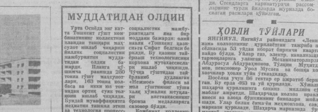
СУРАТДА: 1-Қорақамин массивининг 4-микрорайонида қурилаётган турар жой бинолари. Бу ердаги биноларни асосан «Жилстрой» трестининг монтажчилар бошқармаси азаматлари қуришмоқда.

ахши борапти. Бу, берилган маълумотга қўра, албатта. Агарда, синчилаб қаралса, дарахт ўтқазилган 64 процентга, ниҳоллар ўтқазилган эса, 115 процентга баъжаришга қўра.