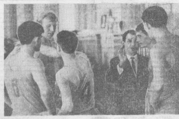
Тренер ўйин давомида бир минутлик танаффус олди хуқуқига эга...

Гренобль шаҳрида очиледиган киши Олимпиада ўйинлари тантанасининг кульминацион нуқтаси ўттиз минг гулдан иборат ташкил этилган гул ёмири билан нишонланади.