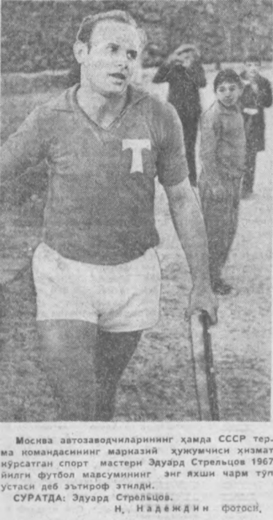
Москва автозаводчиларининг ҳамда СССР терма командасининг марказий хужумчиси...

«Динамо» стадионининг спорт залда 8ш самбочилар кураши тамом бўлди.