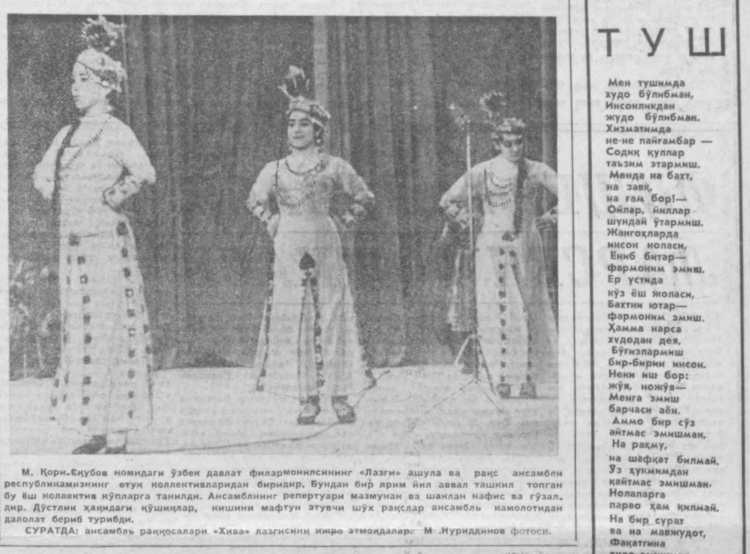
М. Қорн-Екубов номидаги ўзбек давлат филармониясининг «Лаэги» ашула ва рақс ансамбли республикамизнинг етук коллективларидан биридир. Бундан бир ярим йил аввал ташкил топган бу йш коллектив кўп йилларга танилди. Ансамблининг репертуари мазмунан ва шаклан нафис ва гузал. Дир. Дўстлик ҳақидаги кўшиқлар, кишини мафтун этувчи шўҳ рақслар ансамбль камолотидан далолат бериб турибди.

МОСКВАДАГИ ЭСКИ УЙ Бу деворда илгинди бир вақт шоҳ расми, Ху бурчакда лилларди хира шамчироқ. Қайга кетди улар? Йўқди на ном, на жисми, Балки яна қайтмоқликка бордир иштиёқ? Юксак шифтини мақташарди хушуд ва мағрур: Ҳар хонада қўрганлайсиз шаффоф самони — Порлаганда қандилларда кўз олгувчи нур... Харобалар ҳиди тутмиш бутун ҳавони, Бу қабрда энди йўқдир қимирлаган жон. Машиналар чаг-тўроқини ташвиш қулу-тул. Омонат бир ҳолда турар илтиб балиқ. Тезда бузиб ташламак энг сўнгги устул, Вайронлар битар. Шаҳар ишар тобора, Бунда майдон бўлар. Гулзор, Гулаб фавора, Немисчадан Носир таржимаси.