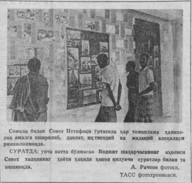
Сомали билан Совет Иттифоқи ўртасида ҳар томонлама ҳамкорлик амалга оширилди, давлат, иқтисодий ва маданий алоқалари ривожланимоқда. СУРАТДА: унча катта бўлмаган Воджит шаҳарчасининг аҳолиси Совет халқининг ҳаёти ҳақида ҳикоя қилувчи суратлар билан таъминланди.

РАБОТ. Бу ерда қирол Ҳасан II раислигида мианстрлар кенгашининг мажлиси бўлиб ўтди. Бу мажлисда давлат вафизлиги судини ташкил этиш тўғрисидаги қону лойиҳасини парламентта тақдим этиш тўғрисида қарор чиқарилди. Ички ишлар, муҳофаза ва юстиция мианстрларидан иборат комиссия ҳам тузилди. Бу комиссия яқинда давлат тўғрисидаги ахволни ўрнини билан боғлаш ҳолатларни ўрганиб чиқди. Маъмулар фитна қатъийлигининг мол-мулкларини мусодара қилишга қаратилган қарорлар қабул қилинди. МАП агентлиги хабар беради: Анжиданган маъмулотларга қараганда, Спират саройидаги отишма вақтида қирол Ҳасан тузилган қўн муносабати билан ўтказилган маросимда ҳозир бўлганлардан 10 киши ўлдирилган. Бундан ташқари фитна қатъийлигининг 168 аъзаданларининг ахволга қараб, 50 киши қўзғолончи юрибди. Работдан Қасабанкага олиб борадиган йўлда ҳарбийларнинг жуда кўп контроль постлари ишлаб турибди Қасабанка порти вақтинча ёпиб қўйилди. (ТАСС).