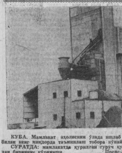
КУБА. Мамлакат аҳолисини ўзида ишлаб чиқарилган гуручлар билан кенг миқдорда таъминлаш тўбора қўйилмоқда. СУРАТДА: мамлакатда қурилган гуруч қурилиш корхоналари- дан бирининг кўриниши.