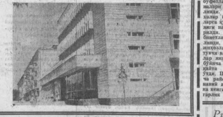
Суратда: ателье биносининг кўриниши.

Чилонзор массивининг Рафур Гулом кўчаси- даги «Янгиллик» ательесида тикув машиналари ва техника воситаларини ўрнатиб бошланди. Янги ательеда яқин орада дастлабки буюрт- мазар қабул қилинади.