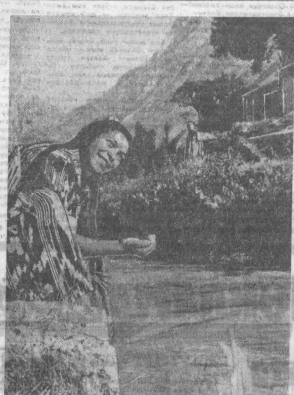
«Сув ва сулува».

Шунда турк ухлаб ётган кишини қамқини билан савадай кетди. Чўчиб ўйгонган киши, гап нимда эналитики билмай ура қочди. Отлиқ уни қувиб, ураверди. Ахир, бир олма дарактининг тагига бориб, қочиб қўзғиб қолди. Турч сулдан тушиб, унинг оғзига кург еган, сасинган олмапарни тиқиб, ейишга мажбур қилди. Сасиқ олмага тўйиб кетган одам ўрнидан туриб, яна қоча бошлади. Турк отга миниб уни қувлаб ети ва тагин ура бошлади. «Суну, ҳам нима» деб ёлворийшга қарамай, бўкиртириб савадарди турк. Ахир, юсура-юсура холдан тойган ҳалиқ киши, қўлини айниб, қайт қила бошлади. Унинг ичидан сасиқ олмани еб шишиб кетган илон ҳам қайтиб тушди. Гапнинг нимада эналитикига өндигина тушунган жаборийда, ўз халоскорининг оёқларига йиқилди. С. Иномжонаев тайёрлаган.