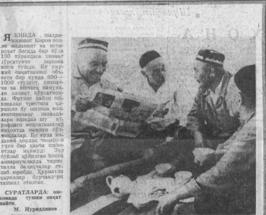
СУРАТЛАРДА: ошхонада тушки оват пайти.