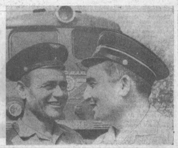
Ўрта Осве темир йўли Тошкент телловоз депосининг машинистла- ри муҳим ҳақ ҳужалғи юклари ортқилан остида уларни муваффақ- қил билан бажариб, беш йиллик топшириқларини шараф билан адо этишди.

Тошкент педагогларни КПСС XXIV съезди қарорларини ҳаёта- та табиқ эта бориб, совет ва партия ташки- лотларининг ёрдами ҳамда жамоатчилик ва оталиқдаги ташкилот- ларнинг ақтир- ки тугайли