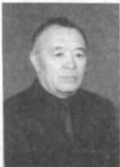
Шараф Уснатдинов, қорақалпоқ адиби