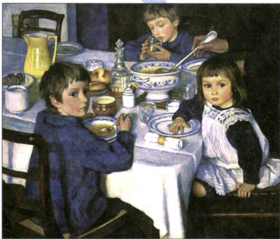
Зинаида Серебрякова. "Нонушита"