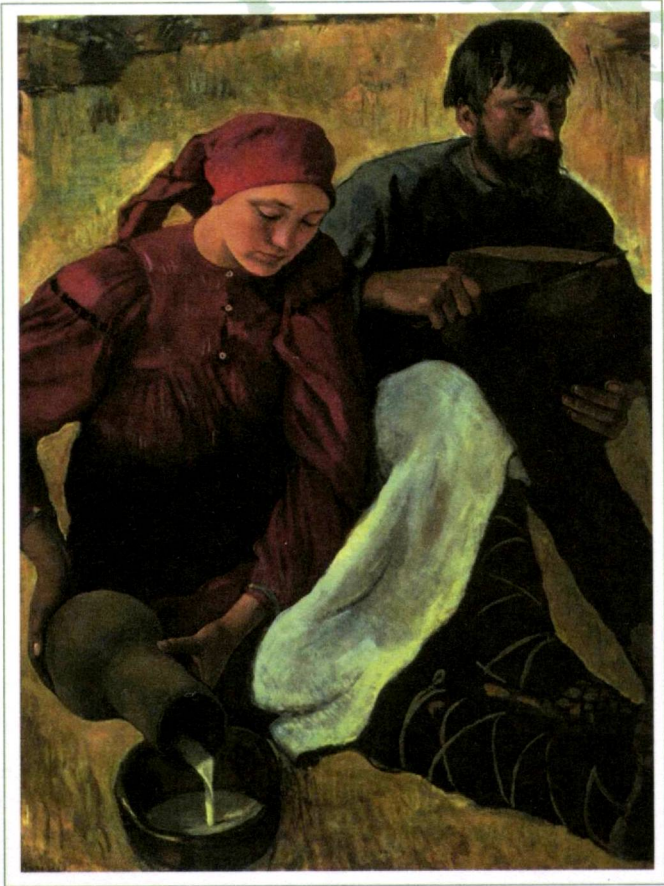
Зинаида Серебрякова. “Деҳқонлар”