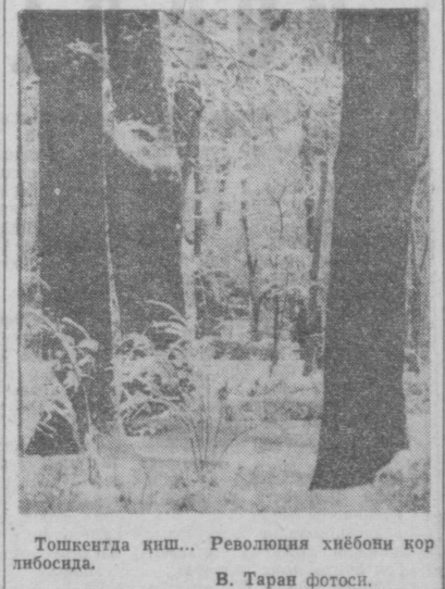
Тошкентда қиш... Революция хиёбони қор либосида.