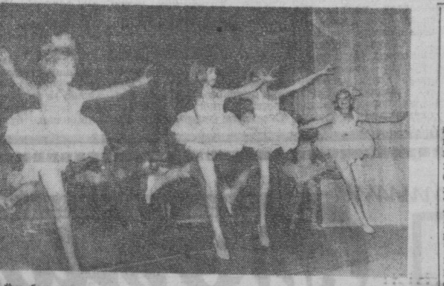
Еш балериналар.

Икки кишини бир-бирига таъништиришга тўғри келса, ёшин катта кишига, арқани аёлга таъништирадлар. Пўталанда, шунингдек, ака урганда овозингизни кўтаришдан ўзингизни тийинг. Қўлингиз, ё бўлмаса рўмолчангиз билан оғзингизни беркитинг. Даструлини одамлар орасида текислаб ўйнаб ўтирманг, уни доимо тоза бўлиши эздан чиқмасин. Идора ёки жамоат жойларида қандай ўтиришни ҳеч қачон унутманг. Оёқини чалиштириб, уянатиб ўтириш, қўл бармоқларини шикрлатиб ўтириш хунук эканлигини унутманг. Еш-аянглар ўтиришган хонадонга ёши каттароқ кишилар кириб қолғиса, ўридан туршини унутмаслик — зарур. Еши улуғ киши ўтирмагунча ёки ўтиришга таклиф этмагунча, унинг ҳурмати учун тик туринг.