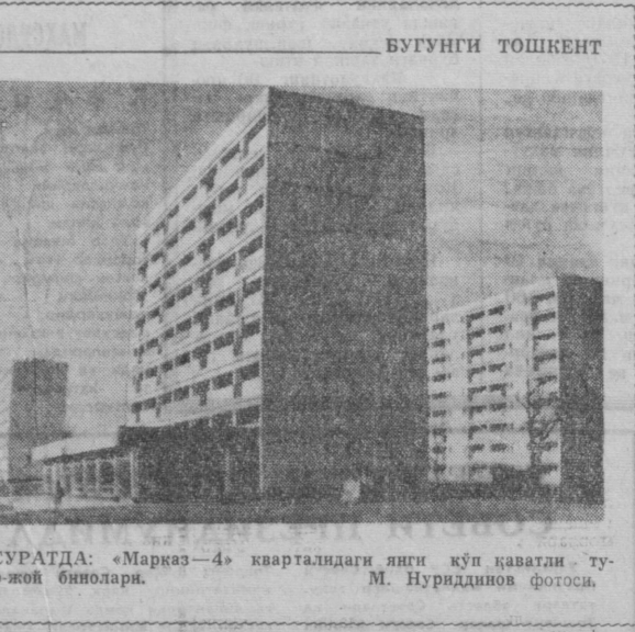
СУРАТДА: «Маркас-4» кварталдаги янги кўп қаватли турар-жой бинолари.