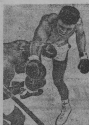
Совин Листоннинг, Кассиус Клей (ўнгда) билан реванш матчи. Бу учрашув бир неча секундгина давом этган. К. Клей 1-раунддаёқ рақибини нокаутга йиқитган.

Этан пулдорларни тикиричлигиб қўйди. Улар кучли ва боқуват Корбетни рингга чиқариш учун тайёргарлик кўра бошладилар. Анча мuddат ўтгандан сўнг катта суммадаги пул тикилади. Салливан шу пулга кўз тикиб, порнок карьерасини бар бот қилди. У 21-раундда Корбетнинг аёвсиз зарбасидан полга йиқилиб, қушидан кетди. Ҳам саккиз ва кичик бўлган, ҳам тезкор ва кучли Корбетнинг галабаси табиий эди.