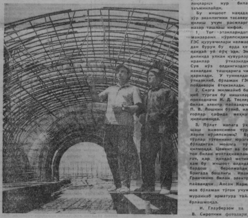
станцияси ҳам Тянь-Шань тоғ этанларидаги шундай улкан иншоотлардан бири. Бу ГЭСнинг тўғони намалан шанлидаги 167 метрли баланд девордан иборат бўлади.