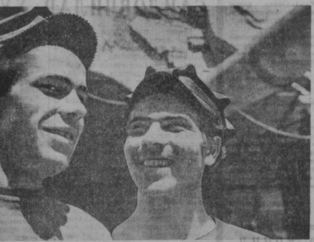
жак ГЭС учун пойдевор кураётган нур яратувчиларнинг бири.