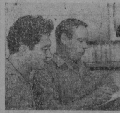
Чилонзордаги Савадо Марнази музика-маданий моллари секциясининг ходимлари аҳолига намунали савадо хизмати ўрсатмоқдалар.

Онтёрбё район прокуратурасининг терговчиси. Ф. Фозиллов.