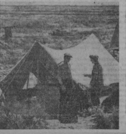
Корақалпоғистон АССР «ВНСМ 45 йиллиги» совхозининг шолитерини далаларида Корақалпоғистон гидрогеология станциясининг таърифа участкаси жойлашган...