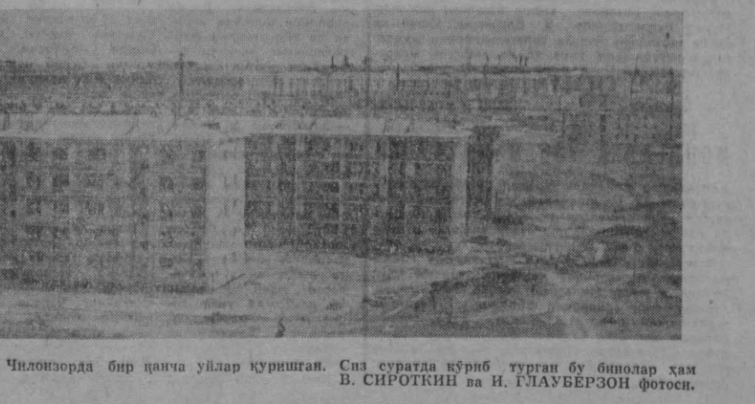
Сиз суратда кўриб турган бу биналар ҳам В. СИРОТКИН ва И. ГЛАУБЕРЗОН фотоси.