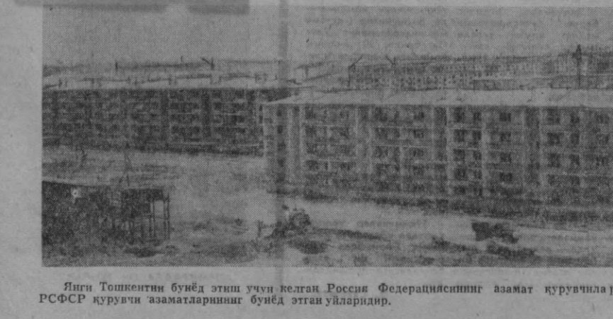
Янги Тошкентни бунёд эттиш учун келган Россия Федерациясининг азамат қурувчилари Чилонзорда бир қанча уйлар қуришган.

Ушундан кейинги кунини ҳам ҳисоб билан бўлади.