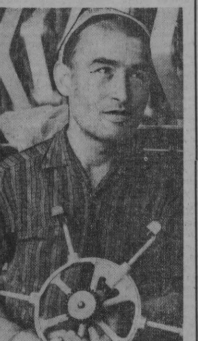
Суратда: Тошкент пиллакашлик фабрикаси...