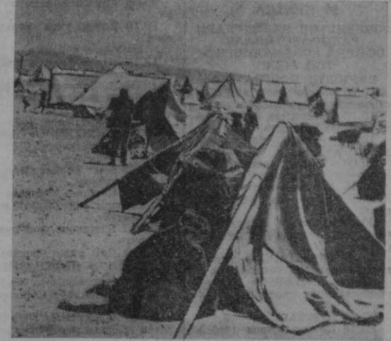
Иорданиянинг пойтахтидан 44 километр шимолда жойлашган «Вади Дейл» лагерини Исроил агрессорларининг зулмидан Иордан дарёсининг ғарбий қирғоғидаги уй-жойларини ва мол,мулкларини ташлаб келган олти минг қочқуч учун вақтинчалик бошлаб бўлиб қолди. Бу ерда икки ярим мингга яқин бола яшамонда. Уларнинг кўплари напалым бомбаларидан жароҳатланган. Суратда: «Вади Дейл» лагериди.

Баёнотда Улуғ Октябрь Социалистик революциясининг 50 йиллигини байрам қилиш жаҳоншумул аҳамиятга эга эканлиги уқтириб ўтилди.