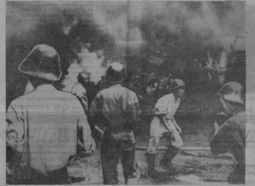
Демократик Вьетнам территориясида уриб туширилган Америка самолётининг қолдиқлари ёнмоқда.