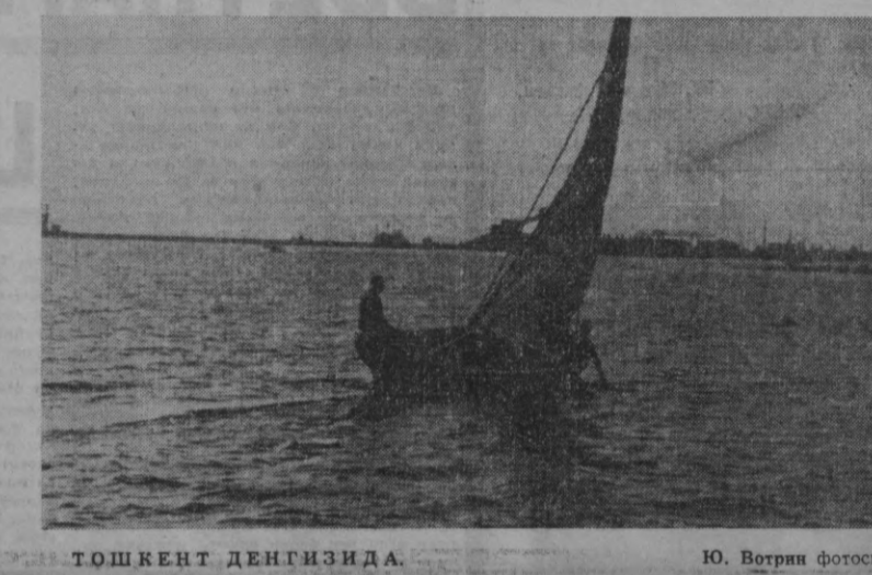
ТОШКЕНТ ДЕНГИЗИДА.

Узоқ Окленденнинг (Янги Зеландия) асосий кўчасида ажойиб бир сакраб қолиш мусобақалари бўлиб ўтди. 50 ёшли фил—Алиса оғирлиги 6,5 тонна бўлган 40 ёшли фил—Жумбонани 880 ярдли масофада орқада қолдириб кетди. Ғолиб сира ҳам бундай мусобақага қатнашмаган эди. Шунинг учун бўлса керак, бу ерлик аҳоли «ёшлик тажриба олдиде ожиз бўлиб қолди» деб ҳазиллаша бошладилар.