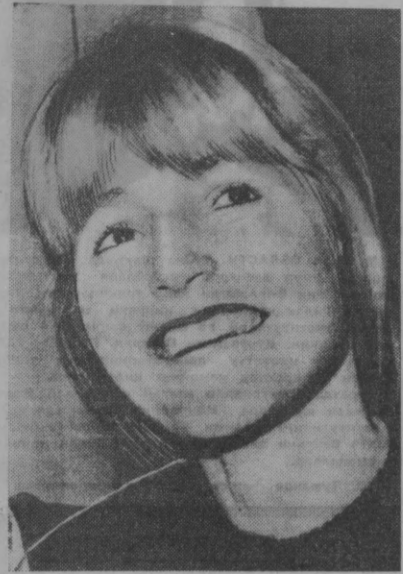
Франция. 28 ёшли Жақлин Дюбу мамлакатда биринчи бўлиб аёллар орасида учувчи бўлди. «Эр Интер» компанияси уни иккинчи учувчи қилиб ишга қабул қилди.