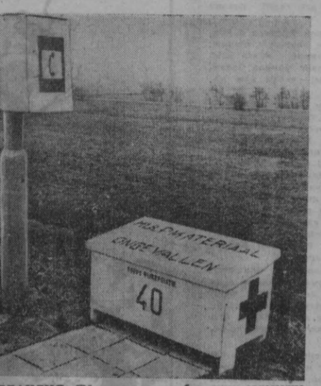
ГОЛЛАНДИЯ. Йўл полицияси бир неча автомагистралларда дастлабки ёрдам шиклини ўрнатди. Ана шундай яншиқларда антечка, иккита одежа, фонарь бор.

Афтидан, мамлакатдаги таъбирли «газеталардан бири» «Нью-Йорк таймс» АҚШнинг ичкини хилват шаҳарасида ўқитувчи билан бўлган воқеани бекорга эълон қилгани йўқ. Бу воқеанинг шу қадар кенг охири килиниши, мазкур воқеа бошқаларга сабоқ бўлсин» деган мақсадни кўзда тутса керак. Гап