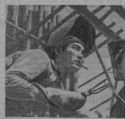
«Главташкентстрой»-га қарашли 1-қурилиш бошқармасининг 2-трест қурувчилари Ленин майдони ёнида 19 қаватли маъмурий бинони тиклашда жонбозлик кўрсатмоқдалар.

Бу йил Тошкентдаги бир неча олий ўқув юрталари янги ихтисос эгалари бўлган кадрларни меҳнат кучига йўллади. Улар республикада олий таълим олган кадрлардир. Ҳар йили кўплай инженер кадрлар етказиб бераётган Тошкент политехника институтини ҳолодликнинг ва компрессорлар бўйича установакалари ва машиналар инженерларининг биринчи отряди тамомлади. Янги фанлар бўйича педагоглар тайёрлаш ҳам кенг йўлга қўйилди. Низомий номидаги Тошкент давлат педагогика институти музыка ва кўшиқ ўқитувчилари ҳуқуқини олган педагогларга оқ йўл тилади. Тошкент халқ хўжалиги институти, Театр-бадий институти каби олий ўқув юрталари учун ҳам бу йил қўшиқ эгаллади.