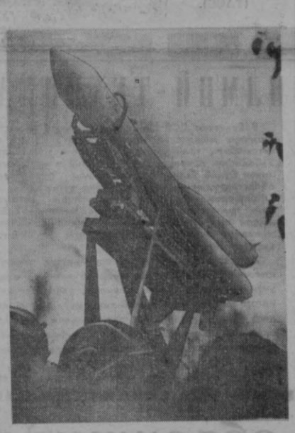
Москвадаги Халқ хўжалиги ютуқлари виставасининг экспонатлари яна бир янгилик билан тўлариди. Бу ерда 1961 йил 12 апрелда космонавт учувчи Ю. Гагарин бошқорган «Восток» космик кемасининг айнан нусхаи қўйилди. Бу нима дунёда биринчи бўлиб космосга парвоз этган.

кино студияларнинг асарлари кенг программада кўрсатилади. Тошкентликлар байрам экраниде пролетарнинг улғу доҳис Владимир Ильич Лениннинг арқин сиймосини кўрдилар. В. И. Лениннинг кўп қиррали ҳаёти ҳақида хикоя қилувчи қатор ҳужжатли фильмлар намойиш қилинди. Кино байрамида «Мосфильм», «Узбекфильм» киностудияларнинг асарлари кенг программада кўрсатилади. Тошкентликлар байрам экраниде пролетарнинг улғу доҳис Владимир Ильич Лениннинг арқин сиймосини кўрдилар. В. И. Лениннинг кўп қиррали ҳаёти ҳақида хикоя қилувчи қатор ҳужжатли фильмлар намойиш қилинди.