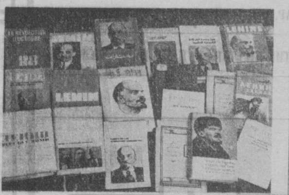
В. И. Ленин асарларининг қўллаб томлари жаҳон халқларининг тилларида топ элган. Бу китоблар В. И. Ленин қомидига Тошкент Давлат университети илмий кутубхонасида сақланади.

«Ташсельмаш» ишлаб чиқарётган пахта тералган машиналарни Ер шарининг тўрт қитъасида учратиш мумкин. Бу ажойиб машиналар жаҳон бозорига ўз мавқенини мустаҳкамлаб, кундан-кунга доғруғи кенг таралмоқда.