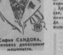
София САЙДОВА, Тапловоз депозитининг машинчиси.

Чунин бизда бунга ҳамма шарт-шароит мавжуд. Меҳнат Қўзма Байроқ орденини «Фазлини тейлар йўлини ишонин билан» тақдирланганми.