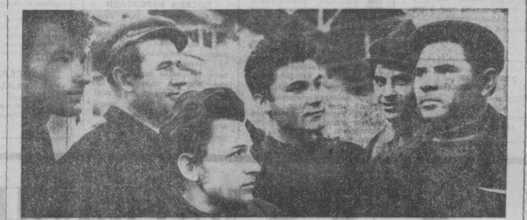
«Ташсельмаш» заводининг 2-механика цехи коллективни шу кунларда ленинча меҳнат вақтасида туриб меҳнат қилмоқда. Ҳам сурағда шу цехнинг меҳнат зарбдорларидан бир гуруҳини қўриб турибди.