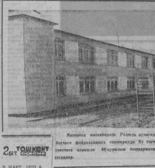
Янгиобод масеяндидаги Радость кўчасида 210 ўришли болалар боғчаси фойдаланишга топширилди. Бу боғчага бешинчи қурилиш трестига қарашли 46-қурилиш бошқармаси биченорлари бунёд атанлар.

Шунга қарамай, халқ қишлоқларида ишларимиз жуда кўп. Айниқса, қўлсизлик, каналзация ўтказиш, газлаштириш ва телефонлаштириш соҳасида қўлгина иш қилиниши лозим.