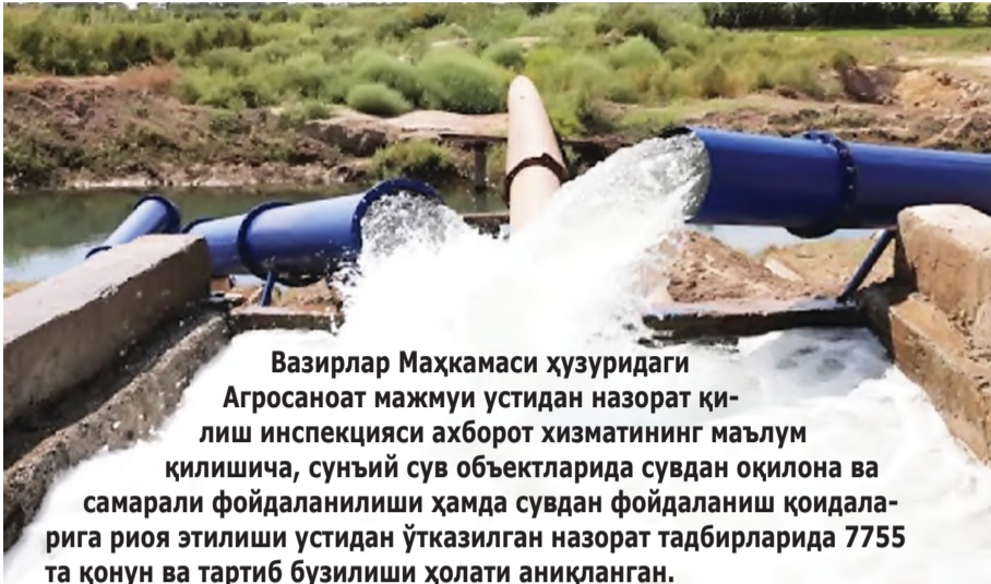
Вазирлар Маҳкамаси ҳузуридаги Агросаноат мажмуи устидан назорат қилиш инспекцияси ахборот хизматининг маълум қилишича, сунъий сув объектларида сувдан оқилона ва самарали фойдаланилиши ҳамда сувдан фойдаланиш қондаларига риоя этилиши устидан ўтказилган назорат тадбирларида 7755 та қонун ва тартиб бузилиши ҳолати аниқланган.