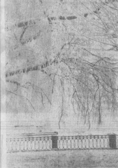
Қадимий шаҳар Вилборг ҳозирги қиш кўнларида ана шундай бўлади.

Ўзбекистон ССР Фанлар академиясининг Кибернетика институти ва Ҳисоблаш марказида янги «Минск-22» маркази электрон ҳисоблаш машинаси ўрнатилди. Белорус олимлари яратган бу мураккаб машинанинг бошқа мамлакатларда ҳам бўлиши мумкин. У кенг тармоқли таъқиқ қилинган ҳолда ҳам ишлайди.