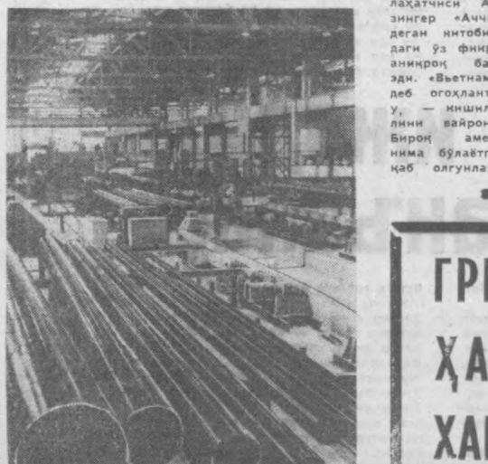
ГДР, Галле округининг Мульденштейн шаҳарчасидаги қурувлари пайвандловчи янги завод яна иккинчи лотини ишта тушириш билан тўла ҳолда ишла бошлади. Қорхона электр станциялар, нефть ва газ қурувлари, химия саноати учун спираль қурувлар тайёрламоқда.

очқиқ айтилмаган кутурган иншилар тўдаси сўз эришилгани бугади. Шундай қилиб, черио томондан қўлаб-қуватланган маънавият жанговар шпор ташлайди, товуши бугунгунча ўшқиради ва ўзининг ирозининг өзсини чиқармончи бўлган ҳар қандай вийдончи иншини ваҳшийларча жазолайди». Бу сўзларни бундан эриш асрдан ҳам кўпроқ нағари ва бошқа воялар муносабати билан Американинг генерал юмористи Марк Твен айтган эди. Унинг эҳсонли, мунофиқлиги, Личи суд ва шахсий арзалигига чўмилдик ишончи билан америкаликларнинг «психологичини» ҳам узартирмайдди. АҚШдаги эҳсонлар Марк Твен томондан шафқатсиз равишда таниқ қилинган шахслардан фарқ қилмайди. Вашингтон риёнорларига қарама-қарши уларок мингларча одади америкаликлар кейинги йилларда кўп нарсани биллиб олдилар. Машҳум сенатор Маккартининг қандай қилиб тўхтаб қолган бўлсалар, улар реакциянинг янги тўқинини ҳам тўхтаб қола олишларига ишонимиз номий. Г. УШАКОВ, (АПН)