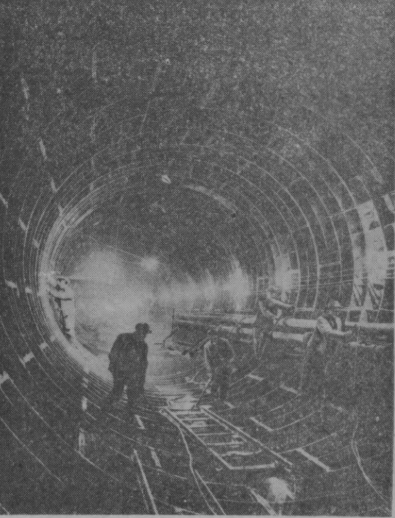
БУДАПЕШТ. Венгрия пойтахтида янги ҳозирги замон метрополитени қуриломоқда. Суратда: Ракоци кўчаси остидан ўтказилган туннельда иш қилитилмоқда.

Исроил маъмурилари Куддусининг Иорданияда тегишли қисмини ўзига қўшиб олишга қаратилган чораларни амалга ошириши ҳам давом этирмоқдалар. Меҳнат вазири Игал Аллон «Библия»ни шахар муниципалитети Куддусининг оккупация қилиб олинган қисмида аҳуидларининг оилалари учун 1000 та уй куриш тў-