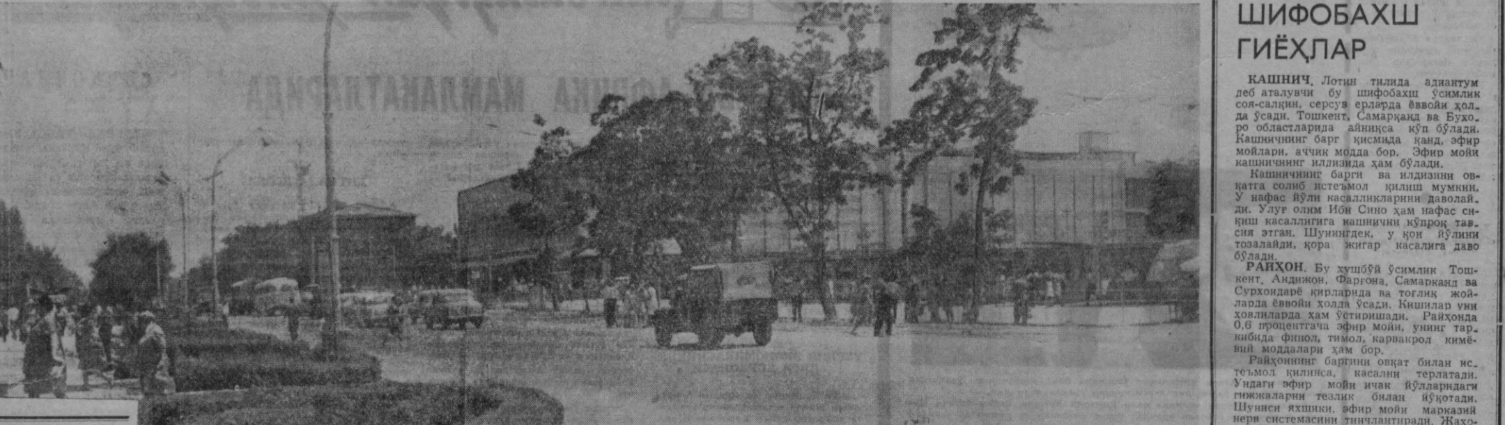
Ташкент Оқшоми 26 БЕТ 22 АВГУСТ, 1967 И. Суратда: Ўзбекистон кўчасининг бугунги кўриниши.