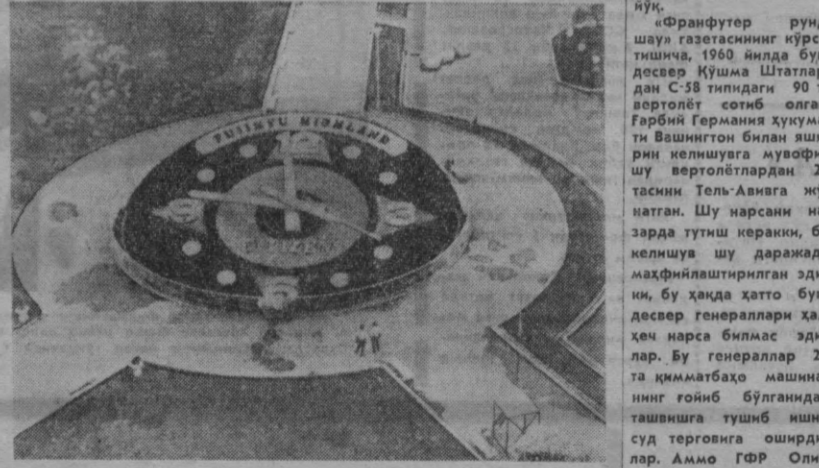
Япониянинг Фудзи тоғ этанларидаги Фудзисида шахарида боғбонлар гуллардан органиал соат инашф этишди. Кинодо — ТАСС фотоси.

да футдан эмас, метр-дан фойдаланадилар, пул системасининг асо-сида эса яна инглиз-ларнинг фарқли ўлароқ ўн рақами ту-ради. «Дейли телеграф» ҳо-зир оддий инглизлар-нинг сабр тоқатини сувиестемол қилиш ўрниги эмаслигини ту-шуниб олди Шенил-ли. «Дейли теле-граф» кеңирим сўрашга мажбур бўлди. А. НИКОЛЕНКО. (АПН).