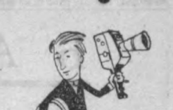
Йўқламайсиз анчадан бўйи, «Лялви Бадашом», Биз шунага ҳайрон.