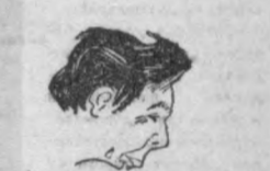
Езувчи Саид АХМАДГА: Ҳақларингиз ўқиб оқшомтон, Бир замонлар бўлганди шодон.