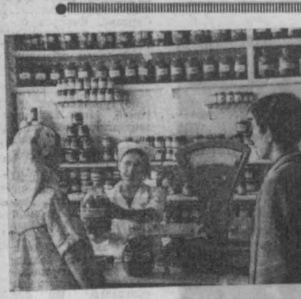
«Ташкент Оқшомид»да Босилгандан кейин... Ташкент Оқшомиди 2 сурат

Янги китоблар «ЖИСМОНИЙ ТАРБИЯ ТАРИХИ» Яқинда «Уштинчи» нашриёти босмадан чиқарган «Жисмоний тарбия тарихи» номли китобни кўлга олган эди спортнинг тарихи ва унинг шаклланишига доир жуда кўп фактларни билиб оласиз.