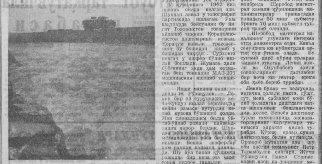
СУРХОНДАРЕ ОБЛАСТИ. Шеробод дашти ўнлаб километрга яқинлаб ётибди. Бу серхосида ерларга сув келтиришни инсон ўнлаб йиллар ора қилган эди.

сое станцияси қурилишига, Қоратос — Туполон каналли трассасига ташкил қилинмоқда. Дашт йўлларида эрта тонгдан тун қоронғисигача машиналар турна қатор қатнаб туради.