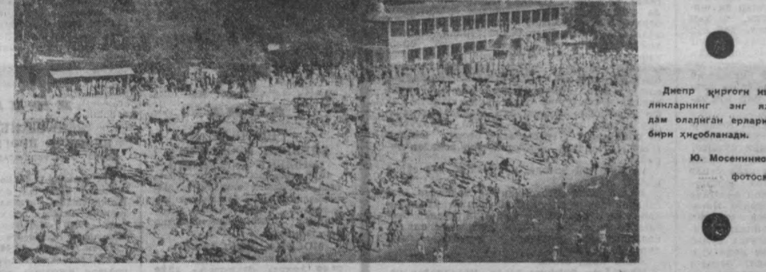
Днепр қирғоғи янги-янгиликларини энг яхши дам оладиган ёрлардан бири қўсбландади.

Тушда қандай информация бўлиши мумкин? Нимага ишониб бўлади-ю, нимага ишониб бўлмайди? Қадимги замон олими Аристотель (Арасту) худого ҳам шайтонга ҳам ишонмас эди. У бу ўринда Утакетган материални. Шу сабабли биз бу дониш билан суҳбатлашшга қарор қилдик. — Туш ўзи нима? Туш кўришда илоҳий кучларнинг роли борлигини тая оласизми? Аристотель. Йўқ. Сиз шундай фикрда бўлсангиз, ҳурматимдан маҳрум бўласиз. Туш кўриш ушбу вақтида сеги организмнинг фаолиятининг натижасидир. Сеги организмнинг бу фаолияти бедорлик вақтида кучлироқ таъсирлар оёсида қолиб кетади. — Туш кўриш ва медицина диагностикасини бир-бирига боғлаш мумкинми? Аристотель. Сиз учун бу ҳақиқат муаммоми? Яхши врачларнинг туш кўришга кўпроқ эътибор бериши зарурлиги равшан эмасми? Кундузи сеги таъсир унчалик кучли бўлмайди, чунки бошқа, кучлироқ таъсир натижасида иккинчи планга тушиб қолади. Ушбу эса аксинча, янги нарсалар ҳам катта бўлиб кўрилади. Чунки, ухлаб ётганингизда кўнглингизга сал ериқди тушиб, қўлурингизга бир-бирига боғ-