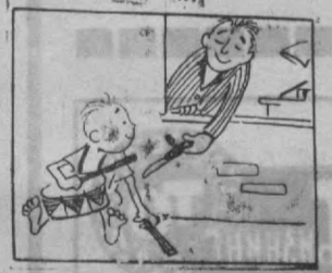
— Ма! Барабанинг ичида нима борлигини биласанми?