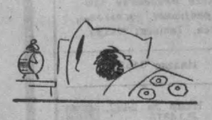
Сўзасиз сурат. Рассом А. Ҳолиянов.