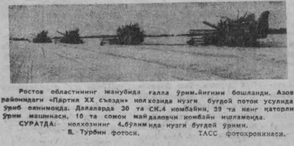
Ростов областининг Иванубида галла ўрми-йиғими бошланди. Азов райондаги «Партия XX съезди» колхозида нузги бугдой потои усулида ўрми шилинмоқда. Далаларда 30 та СК.4 номбайни, 39 та кеиш қаторли ўрми машинаси, 10 та совон май даяловчи номбайни ишлямоқда. СУРАТДА: колхозининг 4 бўлимида нузги бугдой ўрми.

Тошкент денгизда Ўзбекистон пойтахти биринчилиги учун сузим ш бўйича мусобақада бошланди. Эртага спортнинг шу тури бўйича, шаҳарнинг янги чемпиони маълум бўляди. Тошкент денгизда Ўзбекистон пойтахти биринчилиги учун сузим ш бўйича мусобақада бошланди. Эртага спортнинг шу тури бўйича, шаҳарнинг янги чемпиони маълум бўляди.