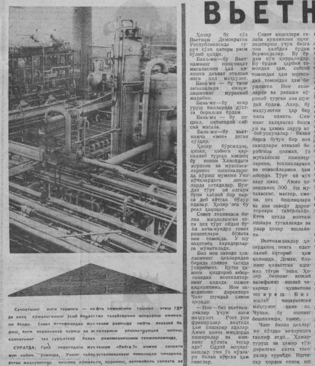
Саноатнинг янги тармоғи — нефть химиясини ташили этиш ГДР да халқ хўжалигининг ўсиб бораётган талабларини қондириш имконини бери. Совет Иттифоқидан мунтазам равишда нефть етказиб бериш, янги корхоналар қуриш ва эскиларини реконструкция қилиш, саноатнинг тез суръатлар билан ривожланишини таъминламоқда.

Француз корхоналарининг умумий бозорда конкуренция қила олиш қобилиятини оширишга мақсадланган ҳадис-ҳисобга келинган қаратилган сибетини давом эттириш учун фойдаланадилар. Ниҳоят улар ишчилар монополияларга қўшимча фойда қўлишга мажбур бўлди. Голландия тушишга муваффақ бўлган «Хушан йўл» партияси — янрик корхоналар ва улар иродисининг илоаткор ишчилари ишчилар май ва юн кундалида улардан тортиб олишга эришган парсаларнинг эг бўлмаси бир қисmini қайтариб олишга ҳаракат қилиб кўради. АПН. Париж, июль.