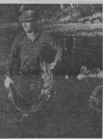
ХАБАРОВСКИЙ УЛКАСИ. Хор, ён оқиниш дарёсидан. Ундан фақатгина ёгон оқинилмай, бундан кўп вақтларда урмончилар балиқ ҳам олашадилар. Балдан тез-тез шундай омодлар ҳам набли туради.

лар энг кўп истеъмол қилинадиган широбакх дориларини аниқлаб, уларни олдидан тайёрлайдиган бўлиб қолдилар. Дорихонанинг ўзиде ишнинг ана шундай стандартиштирилиши гражданиларни бу ерда икки марта заказ бериш учун ва зарур дорини олиш учун мурожаат қилишдан халос этганди. Ленинск шаҳридаги 60-дорихона шаҳардаги беш дорихоналар учун илгир тажриба мактаби бўлиб қолди. Бу ерда провизорларнинг тематик конференциялари ўтказилди, янги препаратларни ўрганиш туғарида ташкил қилинган, кенг кўламли санитария-оқартув пропагандалари олиб боришмоқда. Дорихонанинг жамоатчилик асосида иш кўруви кенгаши ҳам аҳолига медицина хизматини яхшилашда катта ёрдам бермоқда.