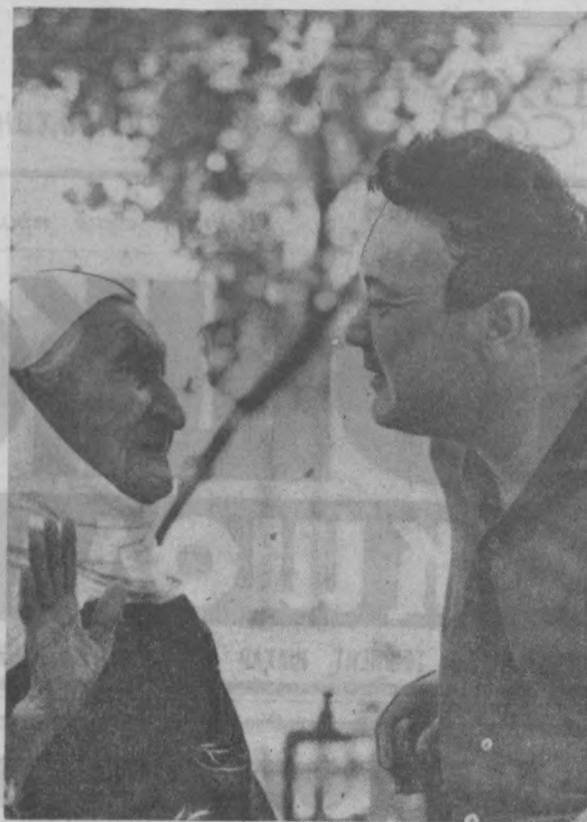
Тошкентнинг Янги Тошкент маҳалласида узоқ умр кўрган, юз йилдан ортиқ ишлаган ишчилар жуда кўп. Улар кўпини кўришган. Ёшлар бундай нуруни ишчиларнинг суҳбатини баён қилаётган тинчлашди, узоқ яшаб «бирларини» билб олишни исташди.