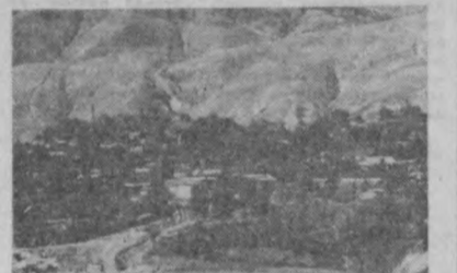
Хаммаси бўлиб бир...