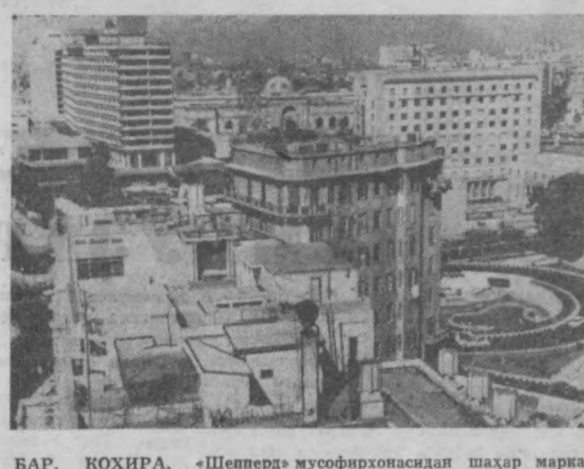
БАР. ҚОҶИРА. «Шепперд» мусофирхонасида шаҳар марказининг кўриниши.

Темир йўл транспорт масалаларига бағишланган бўлиб, яқинда Пекинда ўтказилган кенгашида бош вазир Чжоу энгил сўзлаган нутқининг баъзи тафсилотлари маълум бўлиб қолди. Чет эл матбуотида босиб чиққан маълумотларга қараганда, Чжоу энгил сўзлаган нутқининг баъзи тафсилотлари маълум бўлиб қолди. Чет эл матбуотида босиб чиққан маълумотларга қараганда, Чжоу энгил сўзлаган нутқининг баъзи тафсилотлари маълум бўлиб қолди.