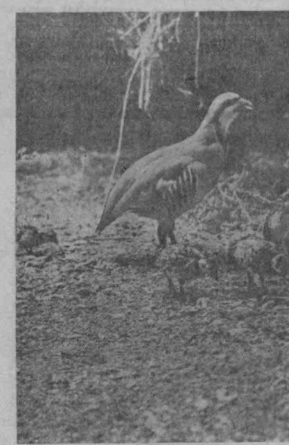
Тошкент ҳайвонот боғида каклик биринчи бор бола очди. Тўққиз какликчанинг ҳаммаси ўзини соғлом сезмоқда.