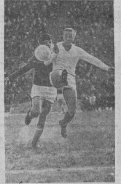
Тўп учун кураш.