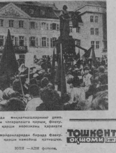
Суратда: Бонн майдонларида бирда фахруллода қонунларга қарши намоён бўлиш натижалари.