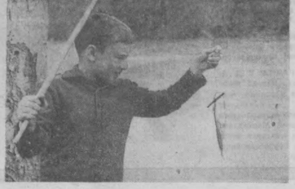
дарёси — анҳор бўйида омади ила, балиқ овлामоқда (ининини суради).