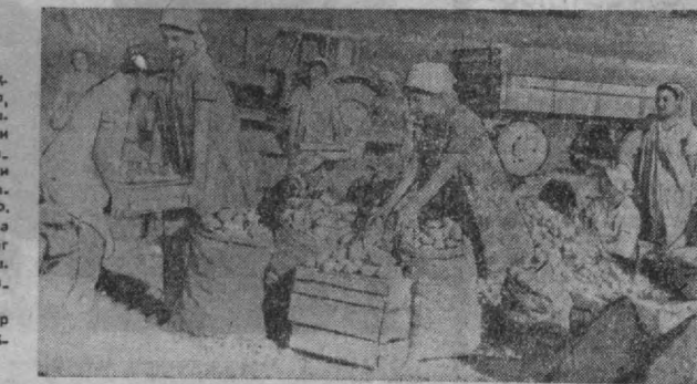
СУРАТДА: ўқувчилар картошка саралашмоқ-да.

Ҳозир дала-ларда пи-шичилик. Миршор, лар пишиб етилган хо-силни нес-нобуз қил-май териб олиб, ша-ҳарликлар дастурхони-га тортиб қилиш учун жон куйдиришпти. Мана шундай долзарб нуналарда Тошкентдаги Крупская номида рес-публика мантибача тарбия педагогика би-лим юртининг бир гуруҳи ўқувчилари «На-зарбе» совхозининг да-лаларида деҳқонларга