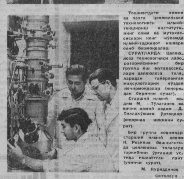
Тошкентдаги химия ва пахта целлюлозаси технологияси илмий-тешириш институтининг олим ва мутахассислари кенг йўлда илмий-тарбиявий ишлари олиб боришмоқдалар.

СУРАТЛАРДА: Целлюлоза технологияси лабораториясининг бир гурупи ўш мутахассислари целлюлоза талаблардан тайёрланган маҳсулотларни кўздан кечирмоқдалар (юқоридан биринчи сурат).