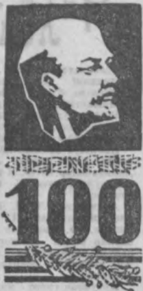
Коллективимиз доҳий В. Н. Ленин туғилган кунининг 100 йиллигини муносиб кутиб олиш юзасидан 1968 йил учун қабул қилинган социалистик мажбуриятни шараф