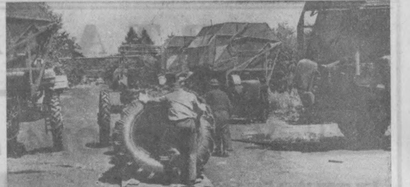
«Ташсельмаш» заводининг азамат машинасозлари янгида «Ўзбекистон» кенг қаторли пахта териб машиналарини оммавий равишда ишлаб чиқаришга киришдилар. Завод машинасозлари пахта териб машиналардан 500 га яқинини ишлаб чиқаради. СУРАТДА: йилуви пехнининг участкалари дан бирда.

Николай СКРИПКО, Авиация маршали. (АПН).