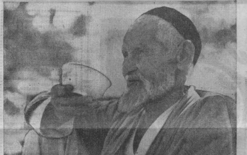
КҲК ЧОЙ. О. ТҲТАХҲҲАЕВ фототўюди.