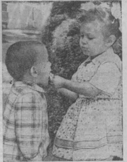
Иккинчизга бир мороженое. Р. Абдураҳмонов фототўюди.

Атлас қўйлак, Чамандагул дўппи, Ортида тўлганар кўша кочили. Қошлари қалдирғоч, Юзлари лўппи О, юракда гулхан ёқилди. Гулхан ёқилди-ю, алағаси Тўла кўчи, Тилим деди: — Синглим! Синглим бўлиб чиқди юрак еса, Кўзим ёқилганар, курга лим — лим! Тошкентдан олди, Денгиз юртида Ўзбек қизин учратдим, рости?! Хайрат етказди, Юрдим ортидан, Ахир, томошага келганлар ози?! Тўхтади, Танимди. Чиндан ўзбек қиз! ..Томошага келмаган экан. Ўзбекча кийими, юзи... сўзи... Аймо у латишга теккан! Уйга таклиф қилди, Бордим уйга Кўён кутиб олди илчи. Кўён, қиз муносиб бўйи-бўйига! Чехраси нурафшон, Сочлари таралган силдиқ Утирдик. Дастурхон... Ичдик, Едик. Келин ҳам ёзма-ён ўтирди бира, Иккисин ҳам олим экан етуг! Мақсаддош, маслақдош бутун умрга! Бахт тўла, кетинга отландим, Кўёвни Тошкентга чақирдим ёда. Қиз, Турар жойимни ёллади, Мен эса қолдирдим унн қоғода. Йўлдан чиқаркан, Менга деди кўё: — Қалай ўзбек қиз! — Рига келини? Мен учун Иккиси ҳам энди биров, Қарши савол бердим: — Эсларим элини?! Кўёв бош силқиди, Соқни жилмайди: — Бир қадам Тошкенту Рига ораси. Ҳафтада кўрмасе ором билмайди, Самолёт соғинчнинг чораси! Севиндим, Кўёвим ўзбек эди худди, Ўзбек дўшсини бошга кийгадим... Шундан бўён ойлари... Яна ойлари ўтди. Неҳалаб учрашдик, Хатлар... Хатлар ёздим. Олам кичраймоқда кўзим ўнгиди. Курра хонадондек, қулақ қўлимда. Дўстлик янграб Дўстлик бўлса, қолди сўзим сўнгиди; Кўзим дўстлар йўлида.