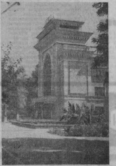
Шахримиздаги темир йўлчилар мада-ният саройи қувида кунга гузалашиб борапти. Янгида Урта Осн темир йў-лининг Тошкент бўлимига қарашли граждн ишхона бўлимида қурувчи-лари маданият саройининг боғида 56 ўринли янги бошлар аттракционни кўриб бердилар. Темир йўлчиларнинг фаразд-лари бу аjoyиб совгадан гоят хурсан.

Чуқки, энди учқур отларга миниб «сайр» этиш, аргимчоқларда учиб маз-за қилиш мумкин. Саройнинг дарвозасидан киришнгиз билан юзасини сув гуллари қоплаган иккита бассейнга қўнгангиз тушади. Эрталаб ва кечқурун бу ер илуфлар очилишини кўришга келган гул ихло-с-мандлари билан гавжум бўлади. Граждн ишхона кўришчи бўлибдорлари яна иккита бассейн қуришни планлаш-тирляпти. Тошкент темир йўлининг ишчи ва хизматчилари В. И. Ленин туғилган кунининг 100 йиллиги шарафига соци-алистик мусобақани аж олдириб, меҳ-