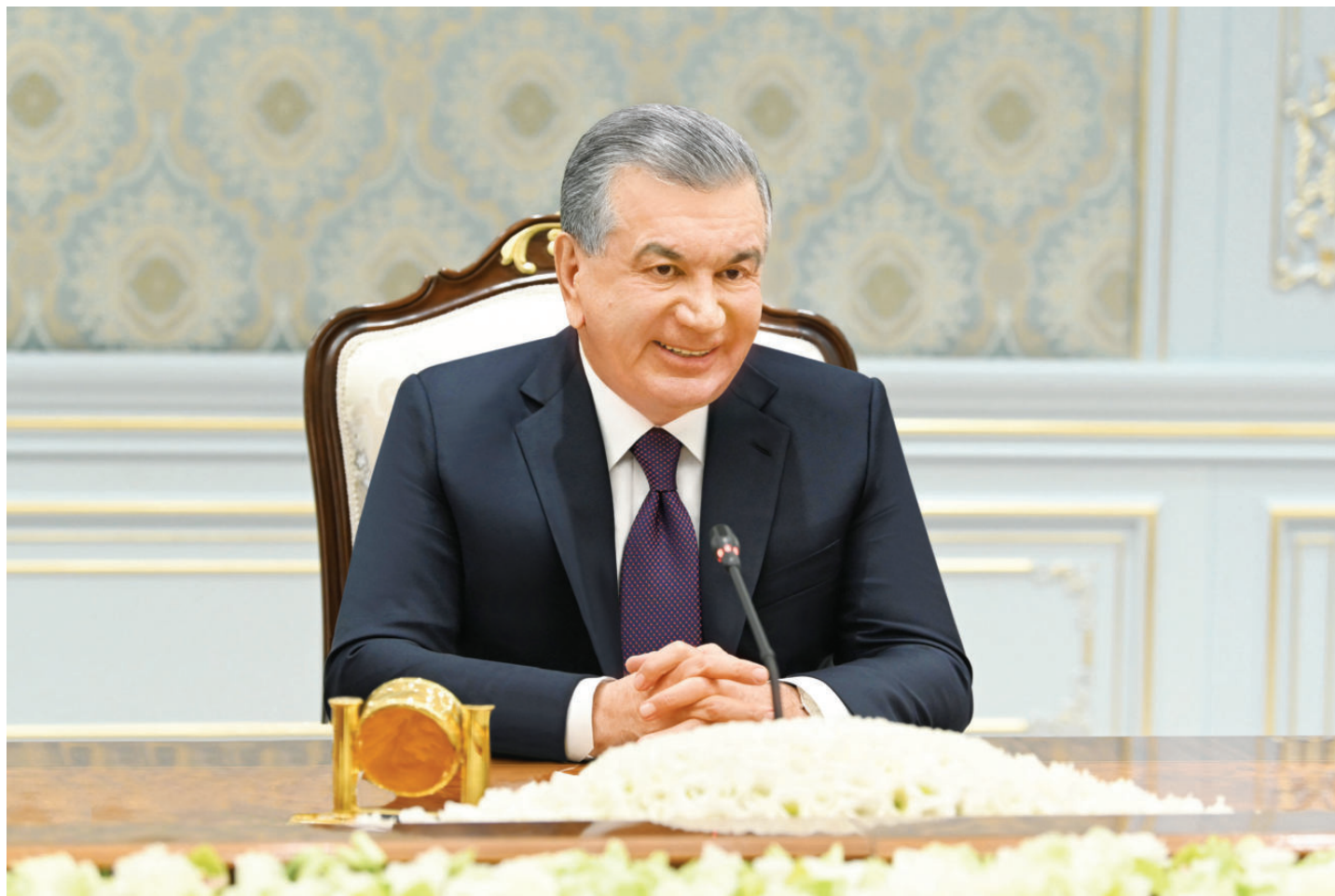
Президент Республики Узбекистан Шавкат Мирзиёев 28 июня принял вице-президента Турецкой Республики Фуата Окта, находящегося в нашей стране с рабочим визитом.

Были обсуждены вопросы дальнейшего расширения практического взаимодействия и продвижения новых проектов кооперации ведущих предприятий и компаний двух стран.