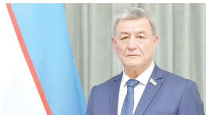
Наримон УМАРОВ, Олий Мажлис Сенатининг суд-ҳуқуқ масалалари ва коррупцияга қарши курашиш кўмитаси раиси

юрт тараққиёти, халқ фаровонлигига хизмат қилади