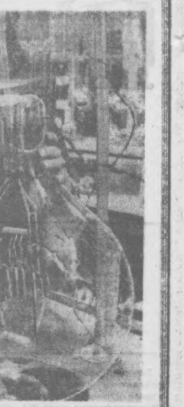
Германия Демократик Республикасидаги Плуэкс заводи улан лампочкаларни қўлаб чиқармоқда. Бу лампочкаларнинг қуввати 26 киловатт.

СУРАТДА: Совет Иттифоний экспозициясида.