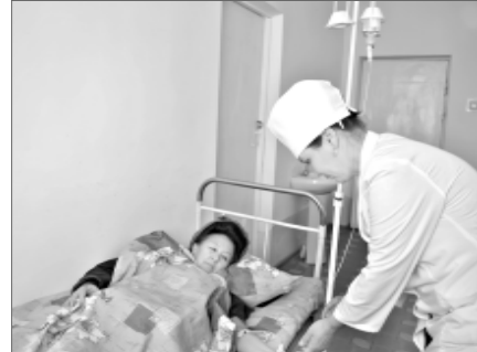
А. Мусаев номли қишлоқ врачлик пункти фаолиятидан лавҳалар.