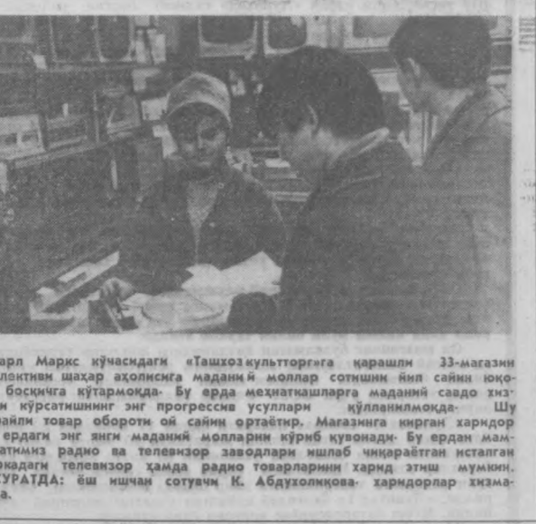
Карл Маркс кўчасидаги «Ташхўлқу» қарашли 33-магазини коллектив шайх аҳлисига маданий моллар сотишни янги сайни юқори босқичга кўтармоқда.

Кенг миғсада олиб бориладиган илмий тадқиқотлар, қолқоз ва совхозлар шароитида тутилган маълумотлар шунга кўрсатдики, эркак қуртлар ўраган иллада соф ипак толаси турғоми кўрт пилласига қараганда 25-30 процент кўп бўлади.