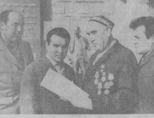
Шоғирд тайёрламаган устоз гўё меъасиз дарахта ўхшайди. Асқар ака эса ўз ҳўнарини кўйлаб ёшларга ўргатган, ажойиб устозлар.