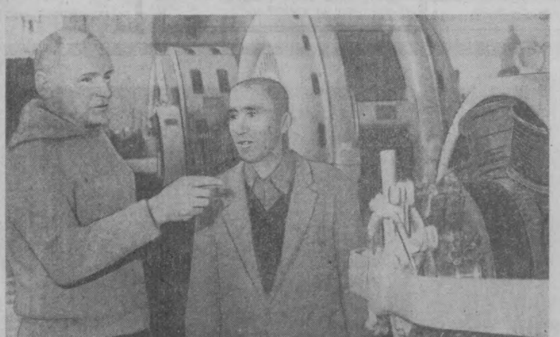
Сиз суратда Бўзсув ГЭСининг биринчи залини кўриб турибсиз. Бу станция 1926 йилдан буюн шаҳар эҳтиёжини учун электр энергия етказиб бермоқда. Станцияда барча ишлар автоматлаштирилган.

Бу эски Москва квартирасидаги ҳамма нарсани кадимги озулар ва албатта, ташвишлар билан ашайди ҳамда нафас олади. Олий математика, физика, техника бўйича илмий ишлар, справочниклар. Катта Совет Энциклопедияси томлари, дунё атласлари — юзлаб китоблар, бўлар ташқи кўринишдан ҳам қундалик, қўлланма адабиятлар экани билиниб турибди.